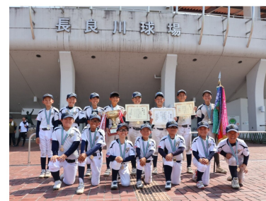
8月15日(木) 長良川球場前にて

2日後の17日(土)には「第20回 高山信用金庫理事長旗学童野球大会」の決勝で古川クラブと対戦し、10-0の完封勝ち！2連覇を果たしました。